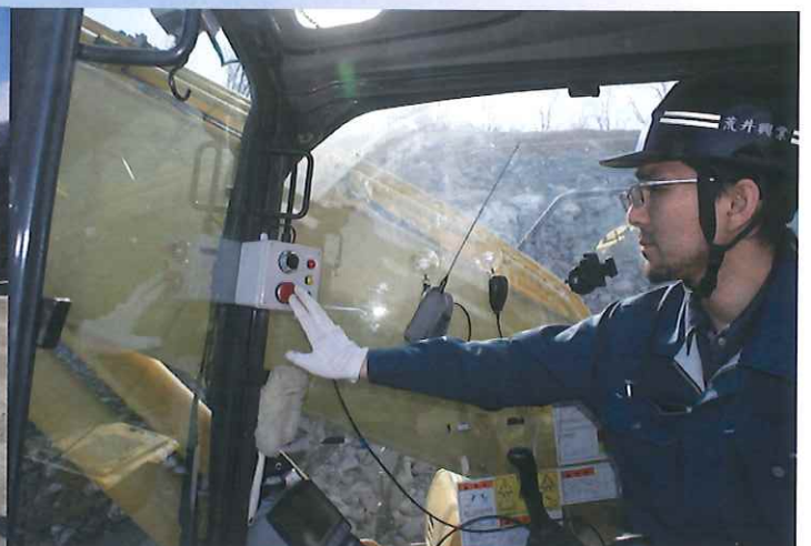
オペレーター操作状況