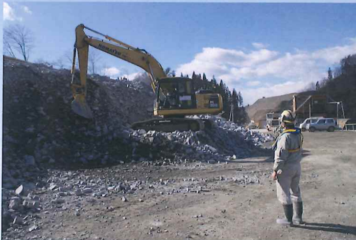
リモコン指示状況