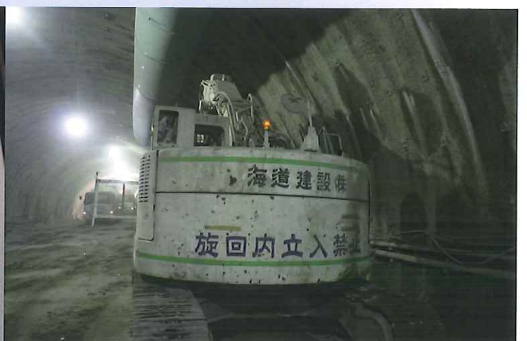
積層型パトランプ取付け状況